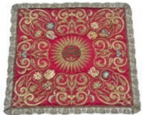
Kelkvelum met bloemen uit de oud Katholieke kerk van Oudewater ca 1650.