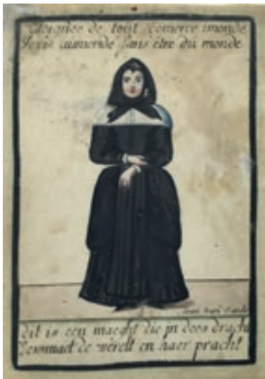
Geestelijke maagd, gravure uitgegeven door Joannes van den Sande, ca 1700.