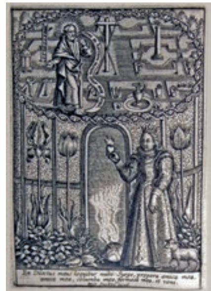
Maagd die haar Bruidegom Christus navolgt in De besloten hof met Arma Christi, gravure van Michael Sniijders, ca 1640.

Aan het einde van het Nieuwe Testament volgt tot slot nog een uitgebreide beschrijving van het Hemels Jeruzalem in de openbaring van Johannes. In de Apocalypse wordt de heilige stad Jeruzalem beschreven als een vierkante stad van zuiver goud en muren van jaspis, helder als glas. Het paradijs is daarom op veel afbeeldingen afgebeeld als een vierkante stad.