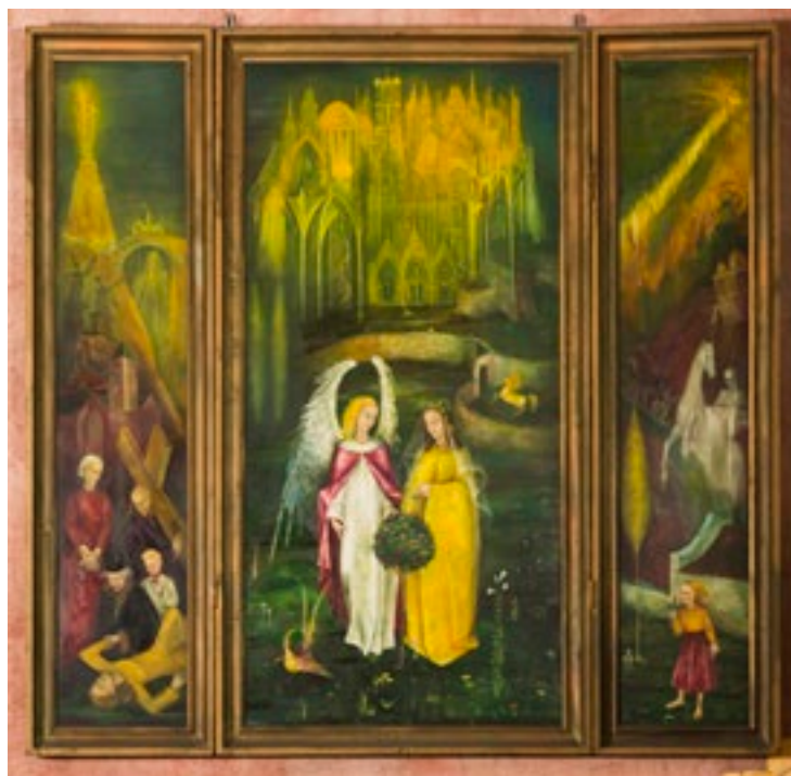
Het leven van de H. Liduina, Gérard Héman, 1945.

die zelfs in zijn keramieke tableaus enerzijds zeer stilistisch werkte, maar er wel in slaagde deze werken een emotionele lading van compassie en liefde mee te geven.