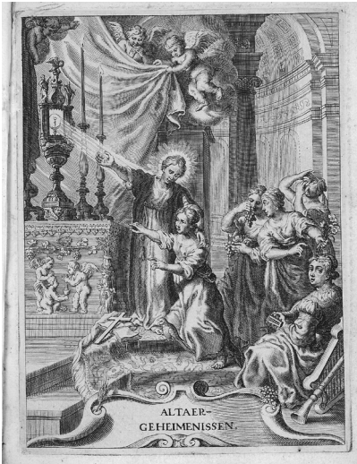
De aanbidding van het H. Sacrament door de vijf zintuigen gepersonifieerd door vrouwen, titelpagina van J. van Vondel, Altaergeheimenissen (Keulen 1945)