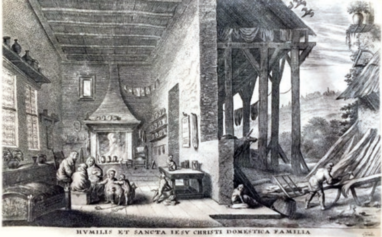
Huisinterieur met de H. Familie, gravure van Cornelis Galle, ca 1670.