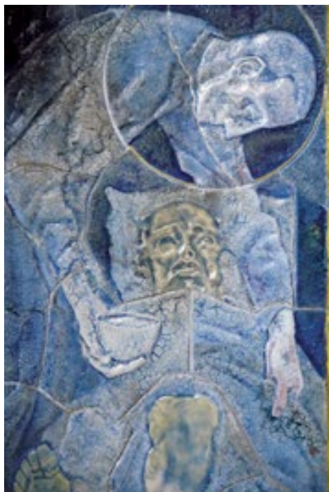
Tegeltableau met Aloysius die een zieke pestlijder verzorgt, Jan Toorop, 1907.