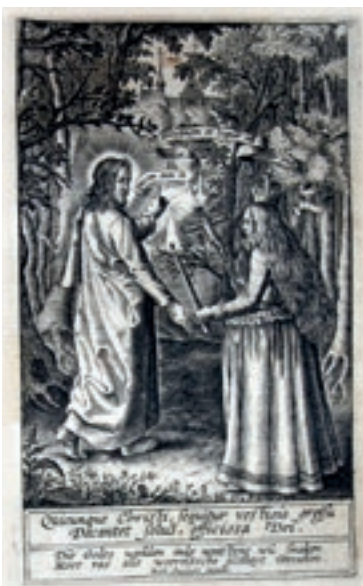
Maagd die haar Mystieke Bruidegom Christus volgt, gravure door Michael Snijders, ca 1640.

slechts 400 à 500 actieve priesters. Het is aan deze vrouwen te danken dat de katholieke kerk in Nederland overeind bleef. De maagschap stond symbool voor zuiverheid, wijsheid en caritas. Ook protestanten respecteerden de maagschap: de Hollandse maagd bleef onveranderd het deugdzaam symbool voor de natie en van vele steden. IJdelheid was echter een hoofdzonde, het is mede daardoor dat deze vrouwen zelden of nooit werden geportretteerd en daarom relatief onbekend zijn gebleven in de geschiedenis van de Republiek.