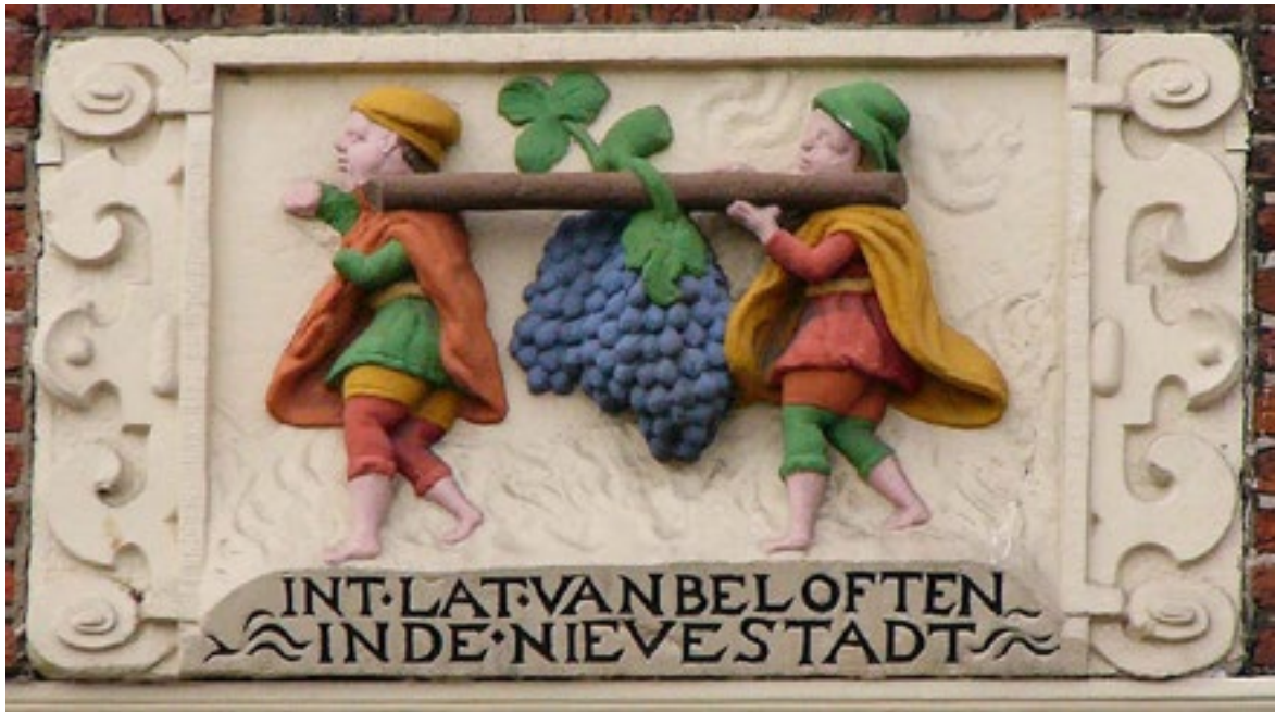
In het land van beloften, gevelsteen op de Nieuwe Beestenmarkt te Leiden, na 1611.

Katholieke (schuil)kerken werden ‘versierd’ met voorstellingen die verwijzen naar De besloten hof. De paramenten, vasa sacra , schilderijen en beelden werden vanaf het begin van de zeventiende eeuw veelvuldig gedecoreerd met de ‘hemelse’ symbolen als bloemen, vruchten en hoornen des overvloeds. De bloemen symboliseerden Christus, Maria en heiligen die met hun deugden bloemen waren geworden om in het leven te ‘plukken’ en te bemediteren. Zo stond de tulp voor de deugd van zuiverheid en de iris voor de H. Drie-eenheid.