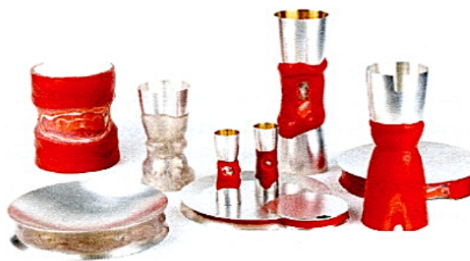
14.5 Ruudt Peters, liturgisch vaatwerk (50-delig; zilver, textiel, polyester), kapel Universitair Medisch Centrum, Vrije Universiteit Amsterdam, 2004

en lessenaar (2007). [p. 35] Door de krachtige kleuren (geel, groen, rood) die 'golven' in het glas, lijken de objecten minder kwetsbaar dan ze zijn. De tafel heeft de vorm van een wolk en is, in het licht van de multifunctionele ruimte, inklapbaar en mobiel.