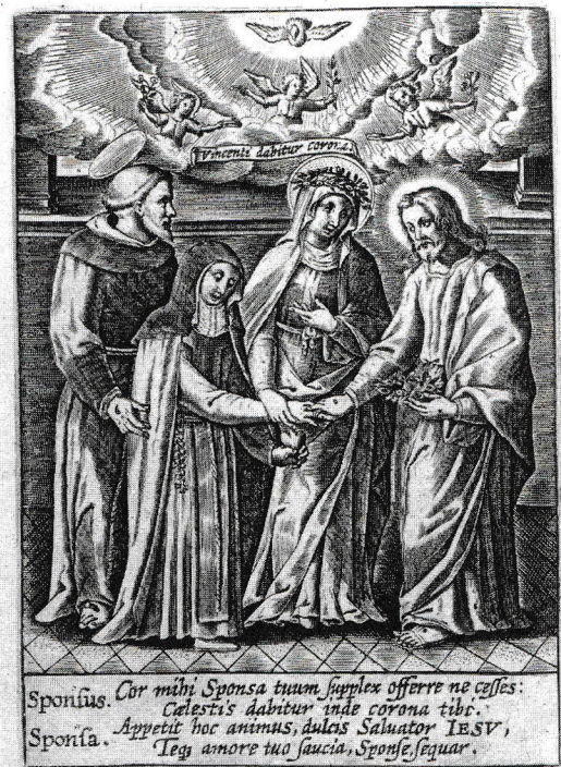
Afbeelding 3a en 3b.