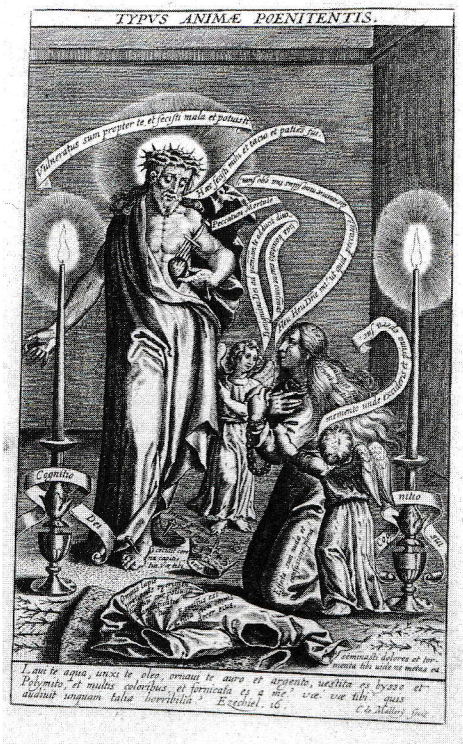
Afbeelding 4a en 4b.

Het heilig huwelijk van het Woord en de ziel en Het Beeld van de boetvaardige ziel. Gravures op papier. Museum Catharijneconvent Utrecht BMH h82 t.o. 139r en 113r.