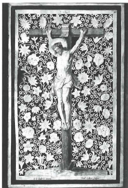
8.2 | Guillaume Collaert naar Peter Paul Rubens, Kantprent: Christus aan het kruis, omringd door bloemen . Gravure op papier, 27,5 × 16,5 cm. Arnhem, Nederlands Openluchtmuseum