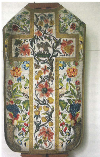
8.7 | Wit bloemenkazuitfel, ca. 1650. Amsterdam, Oud katholieke kerk HH. Petrus en Paulus (De Ooievaar)

Vanaf het begin van de 17de eeuw kregen Noord-Nederlandse huis- en schuilkerken een overdadige aankleding met schilderijen, hout-snee- en zilverwerk, geborduurde doeken en liturgische gewaden gedecoreerd met bloemen, kruiden en vruchten: al vanaf de hoge middeleeuwen symbolen van deugden. Als voorbeelden van deze 'mode' dienden devotieprenten die vanaf het einde van de 16de eeuw voornamelijk vanuit Antwerpen werden verspreid. Het roomse kerkgebouw werd nu als