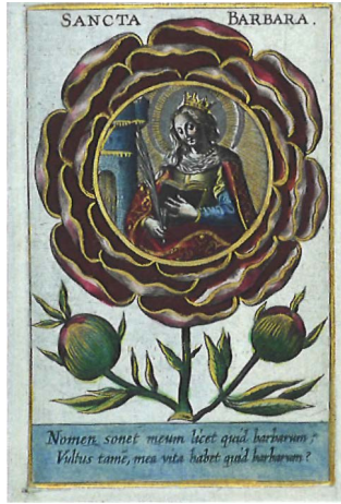
8.4 a, b | Abraham van Merlen (uitg.), St. Franciscus in het hart van een anjer en St. Barbara in het hart van een roos , gravure, ingekleurd met goud, ca. 1650. Ingekleurde gravure op papier. Wolfegg, Kunstsammlungen der Fürsten zu Waldburg Wolfegg

tich witte onafgesette quaerts- ende cantbeelden' en 'Vierhondert sessentwintich fijn cantbeelden'. 17 Het hierbij afgebeelde exemplaar, voorzien van goed herkenbare uitgesneden bloemen, is het enige (gesigneerde) exemplaar van Collaert dat bewaard is gebleven | 8.2. De grote aantallen gesneden en ingekleurde kant- en devotieprenten werden in Antwerpen ook vervaardigd door ambachtslieden.