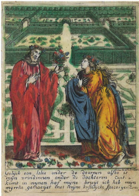
8.5 | Paulus Josephus van de Sande naar Adriaen Collaert, Bruid geeft een boeket deugdzaam bloemen aan haar Bruidegom Christus . Ingekleurde gravure op perkament, 120 × 90 mm. Utrechts Museum Catharijneconvent