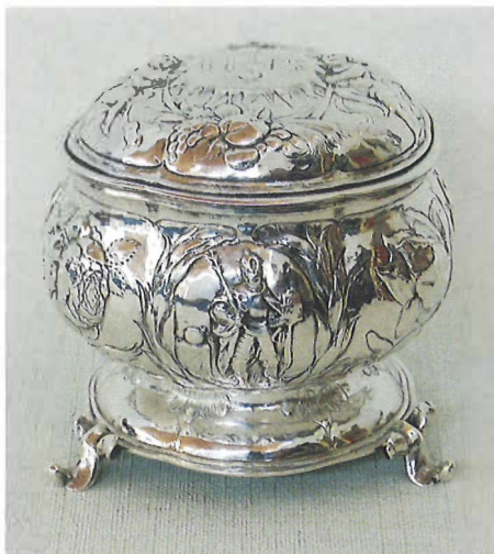
8.8 | Michel Esselbeeck, Oblatendoos met bloemversiering waaronder de roos , Amsterdam, 1656. Nederland, oudkatholiek kerkelijk kunstbezit

Een groot contrast met de gereformeerde protestanten, die geloofden dat de mens was voorbeschikt tot eeuwige heil of verdoemenis (de predestinatieleer), was dat de katholieken geloofden dat het eeuwig leven ook kon worden bereikt door het verrichten van goede werken en een deugdzaam aards leven. In de christelijke traditie werden vanaf de late middeleeuwen deugden symbolisch voorgesteld door bloemen, planten en vruchten. Model voor het eeuwig leven stond de verbeelding van de besloten hof, geënt op de teksten uit het Bijbelse Hooglied. Nu konden in de contrareformatie, tijdens de Tachtigjarige oorlog, planten, bloemen en vruchten een na-