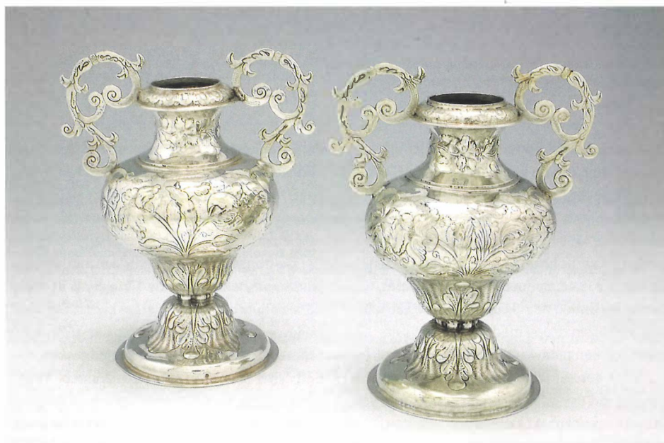
8.9 | Cornelis Gerritse Stam, Twee altaarvazen met bloemdecoraties , Haarlem (?), 1676. Zilver, elk 18 × 14,2 × 10,3 cm. Utrecht, Museum Catharijneconvent