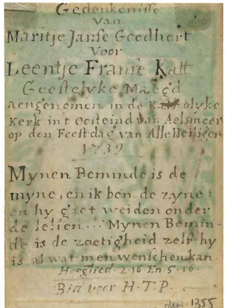
8.6 | Handgeschreven tekst ter gelegenheid van de intrede van Leentje Franse Katt, versozijde van Abb. 8.5

Het verband tussen de oplevende vrouwenmystiek en de bloemenpopulariteit komt prachtig uit in het beeldboek Florilegium uit 1587: een bundeling van 24 prenten van tamelijk precies weergegeven bloemen. Het diende waarschijnlijk als voorbeeld zodat anderen de bloemen konden kopiëren en uitbeelden. Op het door Philips Galle ontworpen titelblad heeft de maagd Christus een boeket van bloemen van deugden gegeven, alvorens zij samen het hemels Jeruzalem betreden. Beiden dragen een bloemenkrans op het hoofd. Dat de verwijzing naar de hemel zo door de geestelijke maagden ook werd opgevat zou je kunnen afleiden uit een later, naar dit voorbeeld gekopieerd eenvoudig devotieprentje,