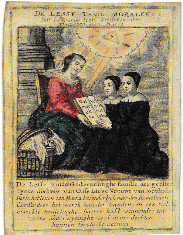
De lesse van de morale · ingekleurde kopergravure op perkament, anoniem · Collectie Thijs

In de vroegmoderne tijd voelden velen zich geroepen om Christus na te volgen. Duizenden vrouwen verbonden zich via een mystiek huwelijk aan hun hemelse Bruidegom Christus en legden bij hun wijding de gelofte van zuiverheid af. De meeste maagden bleven echter, in tegenstelling tot kloosterzusters, ‘in de wereld’ en waren actief met onderwijs en handwerk (bijvoorbeeld borduren en kantklossen). De religieus levende vrouwen waren veruit in de meerderheid ten opzichte van hun mannelijke collega’s. In de Noordelijke Nederlanden werden de geestelijke maagden of geestelijke dochters in de volksmond ‘klopjes’ genoemd. In Vlaanderen heten ze ‘kwezels’. De op pagina acht weergegeven afbeelding van een quesel komt uit een reeks van afbeeldingen over religieuze kleding in de 17de en 18de eeuw.