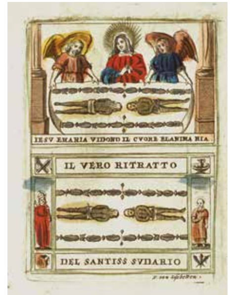
Devotieprent van de lijkwade van Turijn, gegraveerd door P. van Liesbetten ca. 1660 en als reisreliëk mogelijk aangeraakt aan de lijkwade. Tweehonderd jaar later voorin ingebonden in een 15e-eeuws handschrift, dat daarmee extra werd geheiligd. Museum Meermanno | Huis van het boek, Den Haag, MMW10 F 21, f.1r