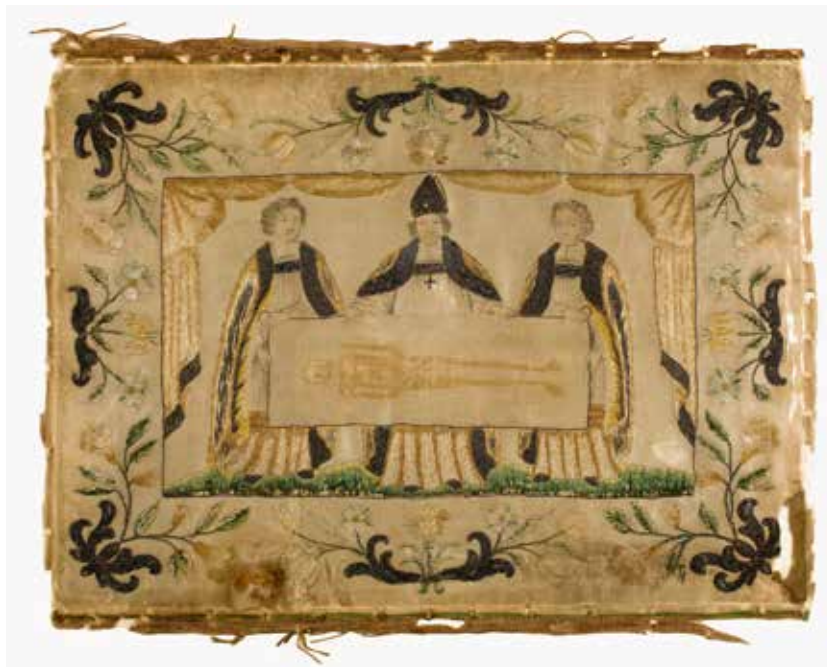
Borduurwerk met de toning van de lijkwade van Besançon door een bisschop en twee kanunniken. In zijde- en zilverdraad met in pen getekende gezichten op een crèmekleurige zijden ondergrond, ca. 1700-1750. Museum Catharijneconvent, Utrecht, BMH t110A